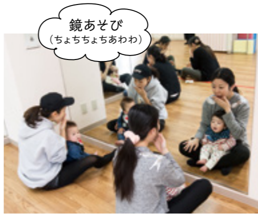
鏡あそび (ちょちちょちあわわ)

大使館などが近隣に多く、国際色豊かな麻布十番。2017年8月にオープンした麻布十番教室は、大きな窓から公園の緑が臨める開放的な雰囲気です。レッスン中の室内は、母子の楽しそうな声が響き、ほのぼのとした雰囲気。先生の指導のもと、お母様方がお子さんに声がけをしている姿からは、愛情と熱意が伝わってきます。0歳児のレッスンで行われていることを、一部ご紹介しましょう。