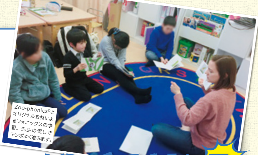
Zoo-phonics®とオリジナル教材によるフォニックスの学習。先生の促しでテンポよく進みます。

ほか、「高一思考力・判断力・表現力対策講座」を用意し、「多面的・総合的評価」へ向かう入試改革に備えました。「思考力、判断力、表現力」は、共通テストの記述問題のほか、一般入試及びAO・推薦入試の論述問題や小論文等でも必須の能力であり、いわば入試改革の「キモ」。一朝一夕に身につく能力ではないので、早期スタートが肝心です。