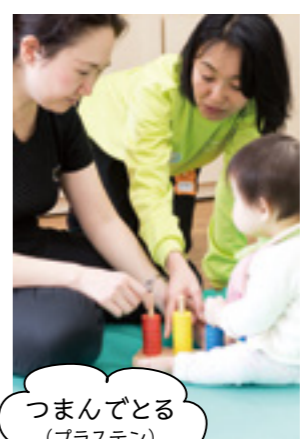
つまんでとる (プラステン)

一時的に物事を覚えておく「ワーキングメモリー」を鍛える遊び。布の下に隠した鈴を取りに行かせます