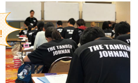
TANREN Tシャツを着て、いざ授業! 気合の入り方も違います。