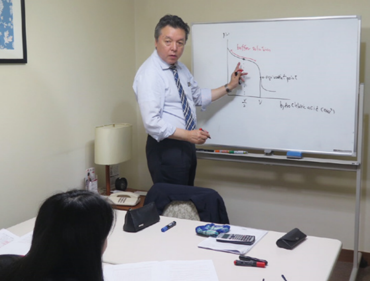
プロの予備校講師の授業がマンツーマンで受けられる、プレミアム個別授業。

受験の最高峰である医学部を受験する生徒にとって、絶対に無駄にできないのが夏。城南医志塾の夏合宿は、8月20日から5泊6日で、千葉県幕張市にて開催されました。朝9時から夜22時まで個々に合わせたプログラムを設定し、講師や職員が徹底管理することで、学習効果を最大限まで引き延ばします。早朝の自習時間にも講師が在席し、質問に対応するなど、不明点を持ち越さないためのフォロー体制も万全です。 合宿後半、やや疲れが見え始めたころには、顧問医師による「医志教育」で気持ちの切り替え。何のために医学部へ行くのか。初心に返ることで、生徒