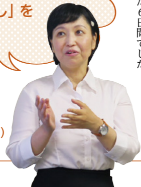
西浦塾長 (城南医志塾)