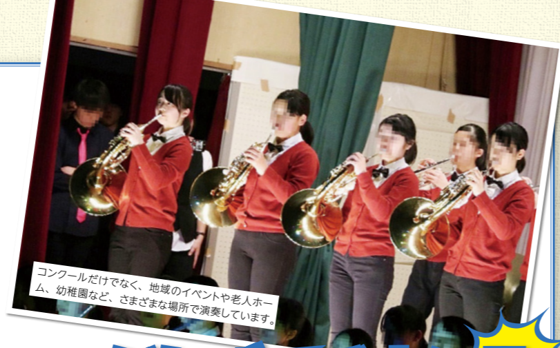
コンクールだけでなく、地域のイベントや老人ホーム、幼稚園など、さまざまな場所で演奏しています。