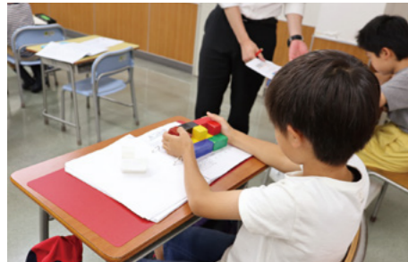
パズルやブロック、迷路など、勉強というよりも遊び感覚で取り組める教材を使用。思考し続ける習慣が身につきます。