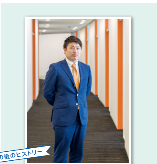
その後のヒストリー

私は現在、結婚情報誌の関西エリア広告営業マネージャー(責任者)を務めています。主な業務内容は、営業メンバーの育成と、担当領域の戦略立案推進です。クライアントは、結婚式場・ジュエリーショップ・ドレスショップ・写真屋さんなど、プライダル関連全般にわたります。広告営業という職種でありながら、本