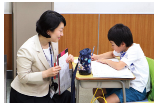
生徒3名に対しりんご塾認定講師が1名つき、わからないと感じた瞬間に質問することができます。生徒と講師の距離が近く、フレンドリーなのもりんご塾の特長です。

出場を決めるトライアル(地方)大会の前日。クラスの1/4の生徒が出場するというので、さぞギリギリした空気かと思いきや、いつもと変わらずのびのびした雰囲気。この余裕(?)も、りんご塾の魅力かもしれません。